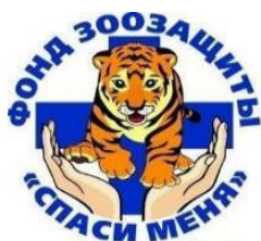
Фонд Зоозащиты «СПАСИ МЕНЯ»