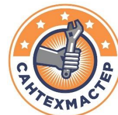
стратегический альянс компаний, производящих сантехнические уплотнители